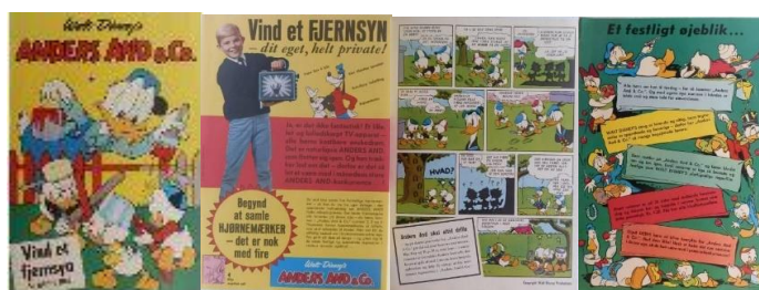
Prøveside med forsiden fra Anders And & Co. nr. 35/65.