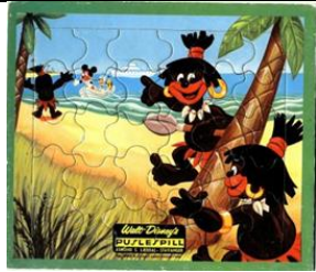
25b., 5002 A