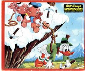
25 b., 5003 A