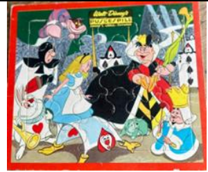
25 b., 5002 D