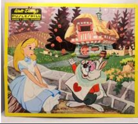
25 b., 5003 B