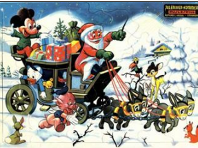
25 b., 394