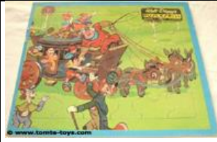
25 b., 5002 B